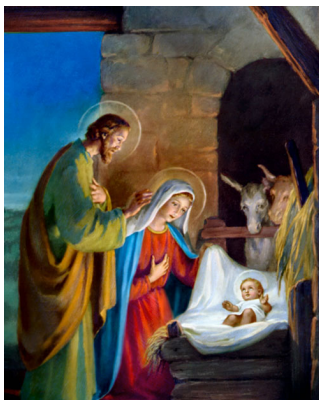
Ыйса Машайактын төрөлүшү