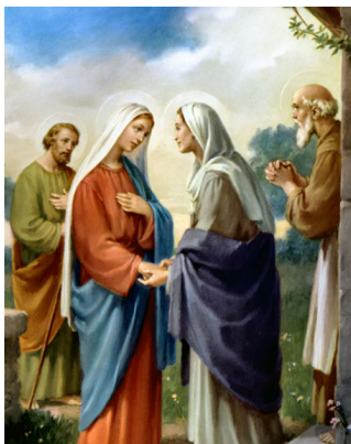
Мариям Элизабетке келет

Ошол күндөрдүн биринде Мариям тоолуу Жүйүт өлкөсүнүн бир шаарына шашылыш түрдө жөнөдү. Ал Захариянын үйүнө кирип, Элизабет менен саламдашты. Мариямдын саламын укканда, Элизабеттин ичиндеги баласы туйлап жиберди. Ошондо Элизабет Ыйык Рухка толуп, үнүн бийик чыгарып, мындай деди: «Аялдардын арасынан сен баталуусуң, түйүлдүгүң ичиндеги бала да баталуу! Кудайымдын энеси мага келгидей, мен киммин? Анткени сенин саламыңды укканымда, ичимдеги бала кубанычтан туйлап жиберди. Ишенгениң үчүн бактылуусуң, анткени Кудайдын сага айткан сөзү аткарылат». Мариям мындай деди: «Менин жаным Кудайды даңктайт. Куткаруучум Кудайды ойлоп, рухум кубанды. Анткени Ал Өзүнүн колунун момундугуна назарын салды. Анткени мындан ары бардык муундар мени “бактылуу” дешет. Анткени Кудуреттүү мага улуу иш жасады. Анын ысымы Ыйык. Ал Өзүнөн корккондорго укумдан-тукумга ырайым кылат. Ал Өзүнүн колунун күчүн көрсөттү. Жүрөгүндөгү ойлору текеберлерди чачыратып жиберди. Күчтүүлөрдү тактыларынан түшүрүп, момундарды көтөрдү. Ачкаларга ырыскыны мол берди, байларды болсо куру кол коё берди. Биздин ата-бабаларыбызга, Ырайымга жана анын тукумуна түбөлүккө ырайым кылууну убада кылганын эстеп, Өзүнүн кулу Ысрайылга жардамга келди». (Лк. 1: 39-55)