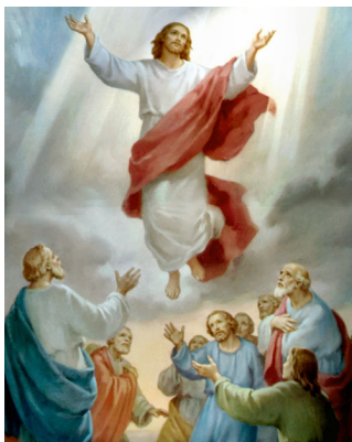
Ыйса Машайактын асманга көтөрүлүүсү

Азап тартып өлгөндөн кийин, кырк күн ичинде Ыйса аларга көрүнүп, Кудайдын Ханчылыгы жөнүндө айтып, Өзүнүн тирүү экендигин көптөгөн далилдер аркылуу көрсөттү. (Ыйык Эл. Иштери 1: 3)