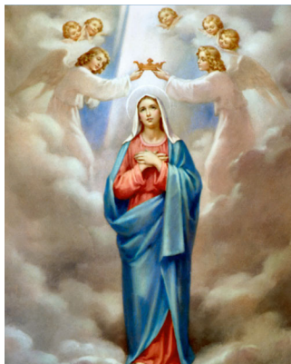
Мариямга асман даңкынын таажысынын кийгизилиши

Боюңа бүтүп, Уул төрөйсүң, Анын ысымын Ыйса коёсуң. Ал улуу болот жана Бардыгынан Жогору Тургандын Уулу деп аталат. Кудай Ага атасы Дөөттүн тагын берет. Ал Жакыптын тукумуна түбөлүккө ханчылык кылат, Анын ханчылыгынын чеги болбойт». (Лк. 1: 31-33)