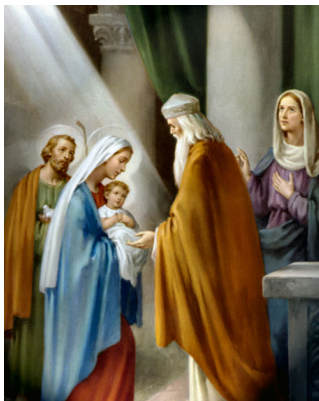
Ыйсаны Кудайга арноо