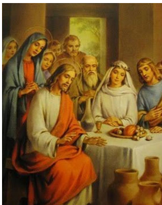
Каана Галилеядагы керемет

Эки күндөн кийин Галилеядагы Каана шаарында үйлөнүү тою болду. Ыйсанын энеси ошол жерде болчу. Ыйса да шакирттери менен бирге тойго чакырылды.