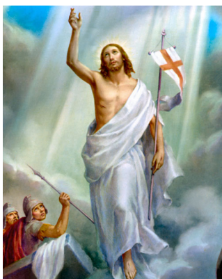
Ыйса Машайактын тирилүүсү

Ишемби күнү өткөндөн кийин, жуманын биринчи күнү таң заардан мағдалалык Мариям менен башка Мариям мүрзөнү көргөнү келишти. Ошол учурда катуу жер титирөө болду, анткени Кудайдын бир периштеси асмандан түшүп келди.