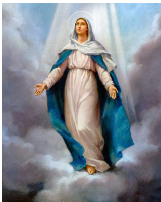
Мариямдын асман даңкына алынуусу