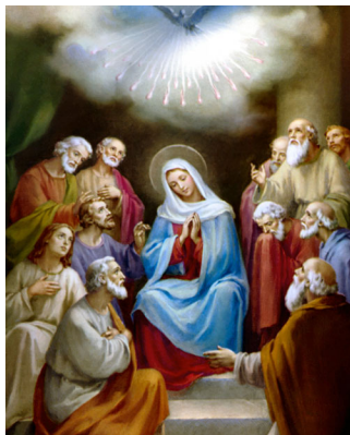
Ыйык Рухтун түшүшү

Элүүнчү күн майрамында алардын бардыгы бир жерге чогулушту. Бир маалда асмандан катуу шамалдын добушундай болгон добуш чыгып, алар отурган үйдүн ичин толтурду. Анан жалындай болгон тилдер бөлүнүп-бөлүнүп, алардын ар биринин үстүнө түштү. Ошондо бардыгы Ыйык Рухка толуп, Рух берген тилге жараша ар кандай тилдерде сүйлөй башташты. (...) Ошондо он бир апостолдун жанында турган Петир үнүн көтөрүнкү чыгарып, аларга мындай деди: (...) Акыркы күндөрдө мындай болот - дейт Кудай, “Мен ар бир адамдын үстүнө Өз Рухумду төгөм, ошондо уулдарыңар менен кыздарыңар пайгамбарчылык кылышат, жаш балдарыңар көрүнүш, карыяларыңар түш көрүшөт”. (Ыйык Эл. Иштери 2: 1-17)