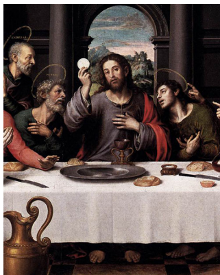
Евхаристиянын сырынын орнотулушу

(Евхаристия — грек тилинен алынып ыраазычылык, ак бата дегенди түшүндүрөт, шарап менен нанды бөлүү, Ыйсанын кечки тамагы)