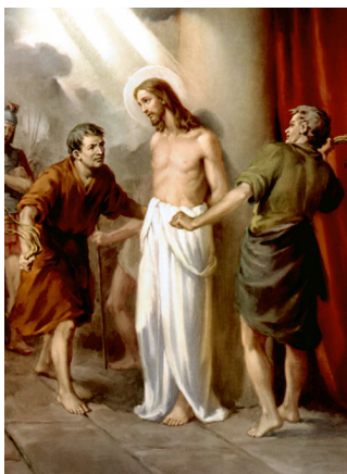
Ыйса Машайактын азапка алынышы

(...) «Менин Ханчылыгым бул дүйнөдөн эмес. Эгерде Менин Ханчылыгым бул дүйнөдөн болсо, анда кызматчыларым Мени жүйүттөрдүн колуна түшүрбөө үчүн күрөшүшмөк. Менин Ханчылыгым бул дүйнөдөн эмес».