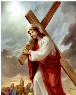
Айкаш жыгачты көтөрүшү