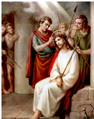
Тикенек таажынын кийгизилиши

«Мен Өз жанымды беремин, ошон үчүн Атам Мени жакшы көрөт. Мен Өз жанымды кайра алуу үчүн беремин. Менден аны эч ким тартып албайт, Мен аны Өзүм берем. Аны берүүгө жана кайра алууга бийлигим бар. Бул осуятты Мен Атамдан алгам». (Жакан 10: 17-18)