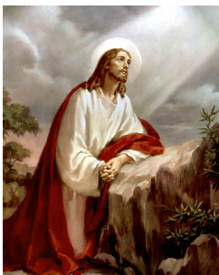
Ыйса Машайактын Гетсеман багындагы сыйынуусу

Анан Ыйса шакирттери менен Гетсемани деген жерге келип, аларга: «Мен тигил жакка барып сыйынып келгиче, ушул жерде отура тургула», – деди. Ал Петир менен Зебедейдин эки уулун жанына ээрчитип алды. Анын көңүлү чөгүп, жаны кейип турду. Ыйса аларга: «Жаным аябай кыйналып турат. Бул жерде калып, Мени менен бирге сергек болгула», – деди.