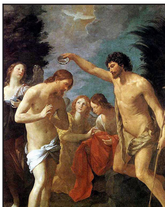
Ыйса Машайактын Иорданда чөмүлдүрүлүшү