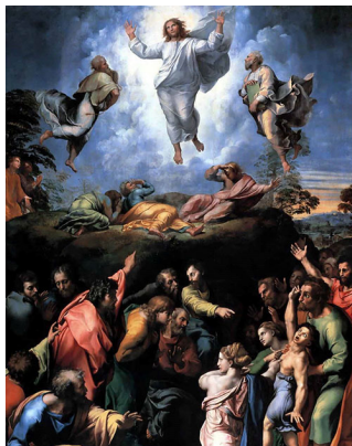
Фавор тоосунда Кудайдын көрүнүшүн өзгөрүлүш

Бул сөздөрдү айткандан кийин сегиз күндөй өткөн соң, Ыйса Петирди, Жаканды, Жакыпты ээрчитип, сыйынуу үчүн, тоого чыкты. Сыйынып жатканда, Анын жүзү өзгөрүп, кийими аппак болуп, жаркырап калды. (Лк. 9: 28-29)